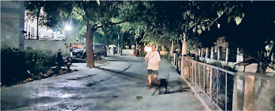
रेवाड़ी। नेहरू पार्क के पास सेक्टर एक में छाया अंधेरा।

बाजार में अंधेरा रहने पर चेन स्नेचिंग व चोरी की वारदात भी होने की संभावना काफी बढ़ जाती है। अंधेरे का फायदा उठाकर चोर कमी भी चोरी की घटना को अंजाम दे सकते हैं, लेकिन प्रशासन की ओर से अभी तक इस पर कोई संज्ञान नहीं लिया गया।