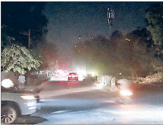
रेवाड़ी। महाराणा प्रताप चौक से अनाजमंडी रोड पर छाया अंधेरा।