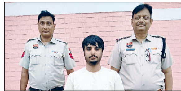
रेवाड़ी। पुलिस गिरफ्तार में फायरिंग मामले का आरोपी।