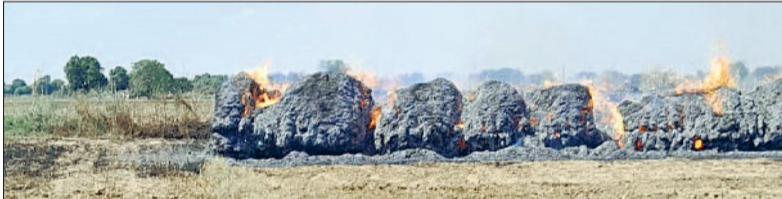
रेवाड़ी। गांव सुनारिया असदपुर में कड़वी में लगी आग।