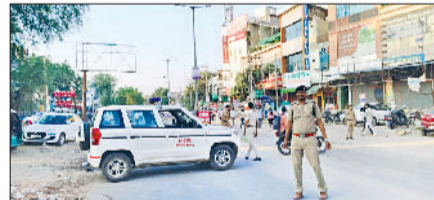
रेवाड़ी। पुलिस की गाड़ी लगाकर बंद किया गया बावल रोड, बावल रोड पर बाँबी देओल को देखने के लिए खड़े लोग, कार्यक्रम स्थल पर शार्ट सर्किट के बाद उठता धुआं।

बावल रोड से आवागमन करने वाले सैकड़ों वाहन चालकों के रविवार शाम उस समय भारी परेशानी का सामना करना पड़ा, जब बाँबी देओल एक ज्वेलरी शॉप का शुभारंभ करने के लिए पहुंचे। इस दौरान लोगों की भीड़ ने सड़क याताया को दोनों ओर से बंद रखा, जिससे वाहन चालकों को दूसरे मार्गों से निकलना पड़ा। रविवार शाम को बावल रोड पर एक ज्वेलरी शॉप का शुभारंभ करने के लिए आयोजकों ने फिल्म स्टार बाँबी देओल को आमंत्रित किया था।