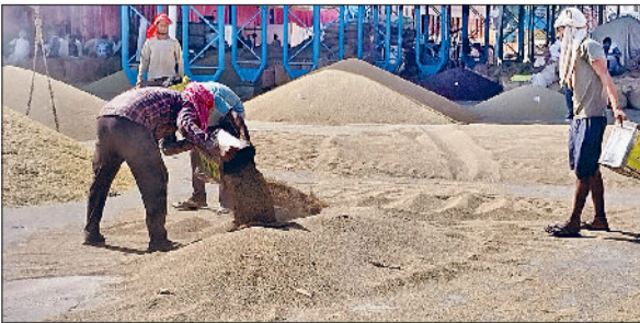
रेवाड़ी। अनाजमंडी में बाजरे की ढेरी बनाते हुए मजदूर।

आसमान साफ हो गया। अधिकतम तापमान 1.0 डिग्री सेल्सियस गिरकर 36.5 डिग्री पर आ गया, जिससे दिन के समय गर्मी से कुछ हद तक राहत मिली रही। रात का तापमान 1.5 डिग्री सेल्सियस बढ़कर 21.5 डिग्री पर पहुंच गया। एक सप्ताह बाद रात का तापमान इस स्तर पर पहुंचा है।