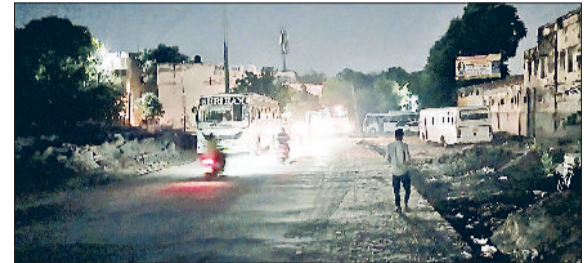
रेवाड़ी। ब्रास मार्केट की मुख्य सड़क पर छाया अंधेरा।

त्योहारी सीजन शुरू होने से मुख्य बाजार में भी खरीदारी के लिए लोगों की भीड़ बढ़ने लगी है, लेकिन शहर के मेन बाजार मोती चौक सहित केवल बाजार, पुरानी अनाजमंडी, सराफा बाजार, जीवली बाजार, रेलवे रोड व बारा हजारी मार्ग सहित कई बाजार स्ट्रीट लाइटें बंद होने से अंधेरे में व्याप्त है। बाजार में अंधेरा रहने पर चेन स्नेचिंग व चोरी की वारदात भी होने की संभावना काफी बढ़ जाती है। अंधेरे का फायदा उठाकर चोर कभी भी चोरी की घटना को अंजाम दे सकते हैं, लेकिन प्रशासन कर ओर से अभी इस ओर कोई संज्ञान नहीं लिया गया है।